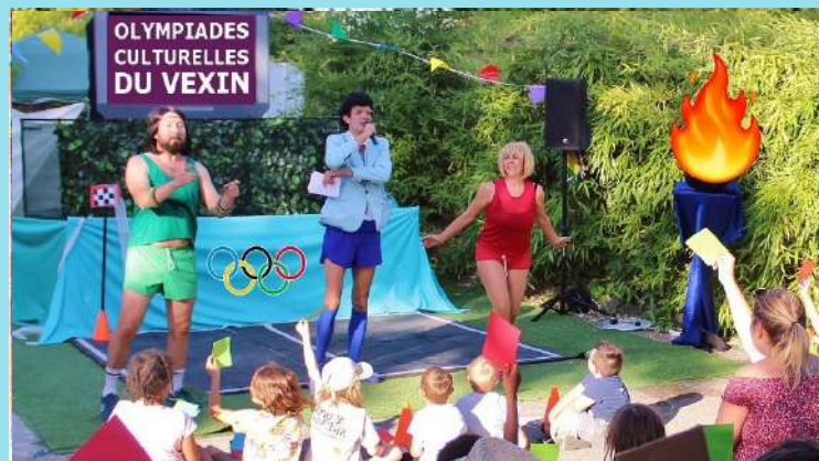
Devenu le jury de cette improbable match, le public fait partie intégrante de ces jeux olympiques déjantés.

Le Goûter aux aînés et aux enfants sera offert pendant ce spectacle en chanson !