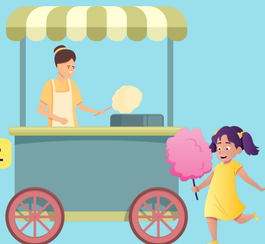
Stand de Barbe à papa FOYER RURAL